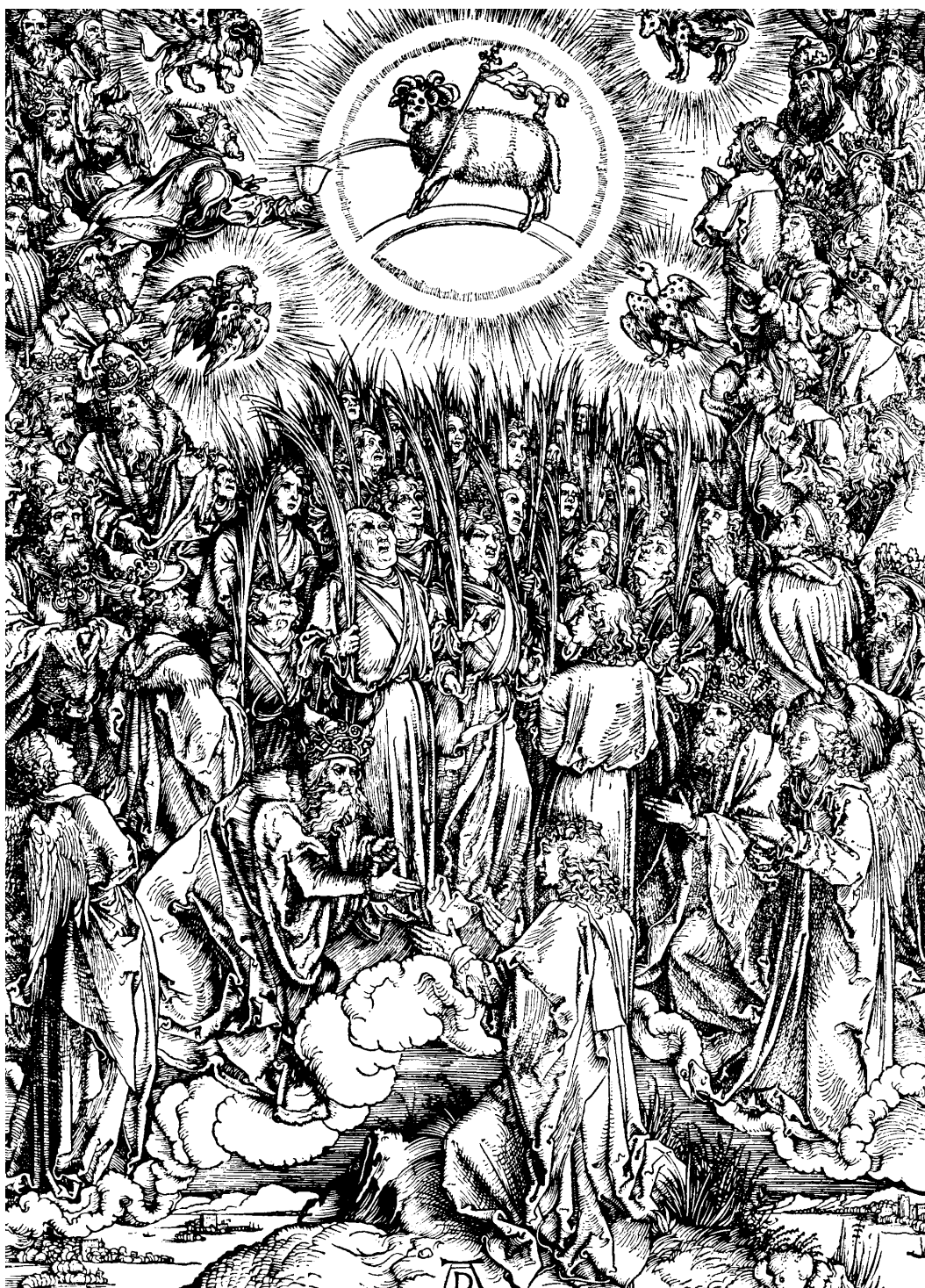
Houtsnede van Albrecht Dürer